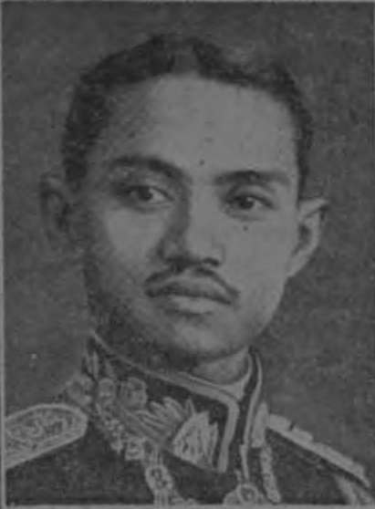
EL REY DE SIAM ABDICA SINGAPORE, 27. — Anunciase que por el resorte de la legación británica en Bangkok, se sabe que el Rey de Siam ha decidido abdicar.

Berlín, 27. — El conflicto religioso se intensifica con el anuncio de que las organizaciones trabajadoras religiosas presionan la remoción de Mueller. Hay otra fuente que cubre enormes influencias para la libertad de cultos. La discrepancia entre estas masas de opinión agitada ahora prevé la inevitable intervención del Fuehrer Canciller quien hasta el momento ha rehusado mezclarse en la disputa.